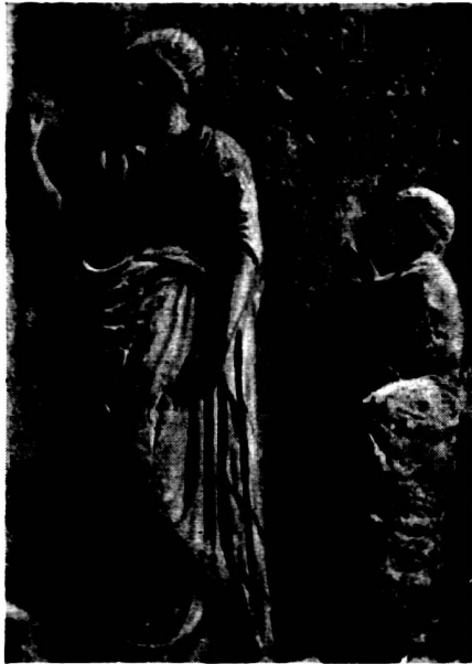
Abb. 5. Relief Louvre.

In der Modellierung der vorderen Mantelseite weicht der Torso nicht so greifbar ab. Dennoch wird man feststellen müssen, daß seine Faltenbahnen auch hier eine größere Schmiegsamkeit des Stoffes zum Ausdruck bringen. Die mangelhafte anatomische Wiedergabe über der Kreuzungsstelle der übereinandergeschlagenen Beine wird dadurch sichtbarer als an den römischen Kopien. Diese kritische Stelle wird durch den herben Faltenfluß an den römischen Kopien weit besser cacht.