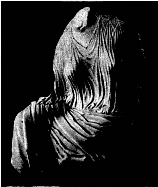
Abb. 1. Persepolis.