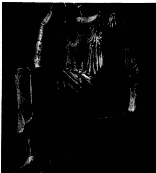
Abb. 3. Vatican.