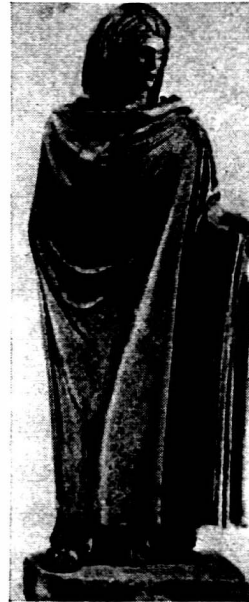
Abb. 6. «Aspasia».

So scheint auch hier die herbere und altertümlichere Formenüberlieferung von den römischen Kopien gegeben zu werden, während die flüssigere und zartere des Torsos mit jüngeren Nuancen durchsetzt ist, die bei aller Schönheit der Gesamterscheinung dem Werk etwas Zwiespältiges geben.