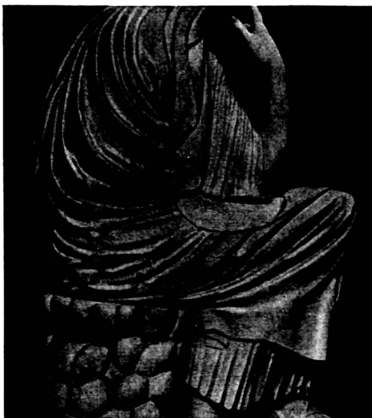
Abb. 4. Vatican.

heraustretende Faltengrate, die sich bisweilen gabeln. An dem neu gefundenen Torso ist es, als hätten sich diese greifbaren und kräftig abhebenden Faltenrippen in ein zartes Spiel sich stauender und verfließender Faltenschwellungen aufgelöst. Deshalb wohl mutet am Torso die Stofflichkeit des ganzen Mantels weicher, gleichsam luftgefüllt an. Er bildet am Rücken und Nacken nur noch tastbare, keine greifbaren Erhebungen 3 . Die Hand, die ihn geformt hat, scheint subtiler und reifer gewesen zu sein als die nuancenärmere, weniger illusionistische an den römischen Kopien. Hier sind es kräftig klare Faltenakkorde in der Art des herben Stils (Abb. 6), dort aber ein in sich verspanntes zartes Wellenspiel von Falten in der dem frühen 4. Jahrhundert geläufigen Modellierung (Abb. 5) 4 .